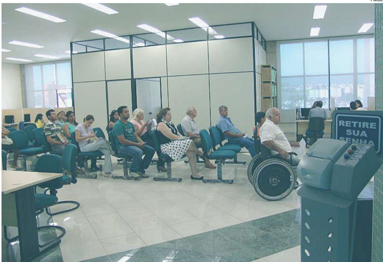
Procon de São Caetano: assessoria aos consumidores

Por isso, continua o diretor, é necessário que o beneficiário ou algum dependente compareça pessoalmente no Procon de São Caetano e leve, se possível, o contrato firmado com a Samcil ou ao menos o boleto de pagamento dos últimos