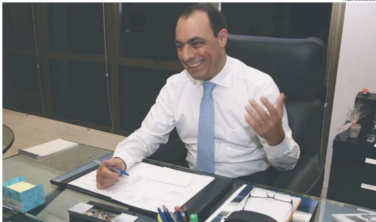
Prefeito Auricchio: premiação por resultado a educadores

Três mil funcionários da Rede Municipal de Educação de São Caetano do Sul deverão receber abono e gratificações temporários, referentes aos meses de abril (retroativo) até dezembro de 2011. A Prefeitura investirá em torno de R$ 1,3 milhão ao mês pelo benefício, o equivalente a R$ 12,4 milhões pelos nove meses correspondentes. O projeto de lei (PL) do Executivo deu entrada na Casa de Leis e será apreciado em duas sessões, provavelmente,