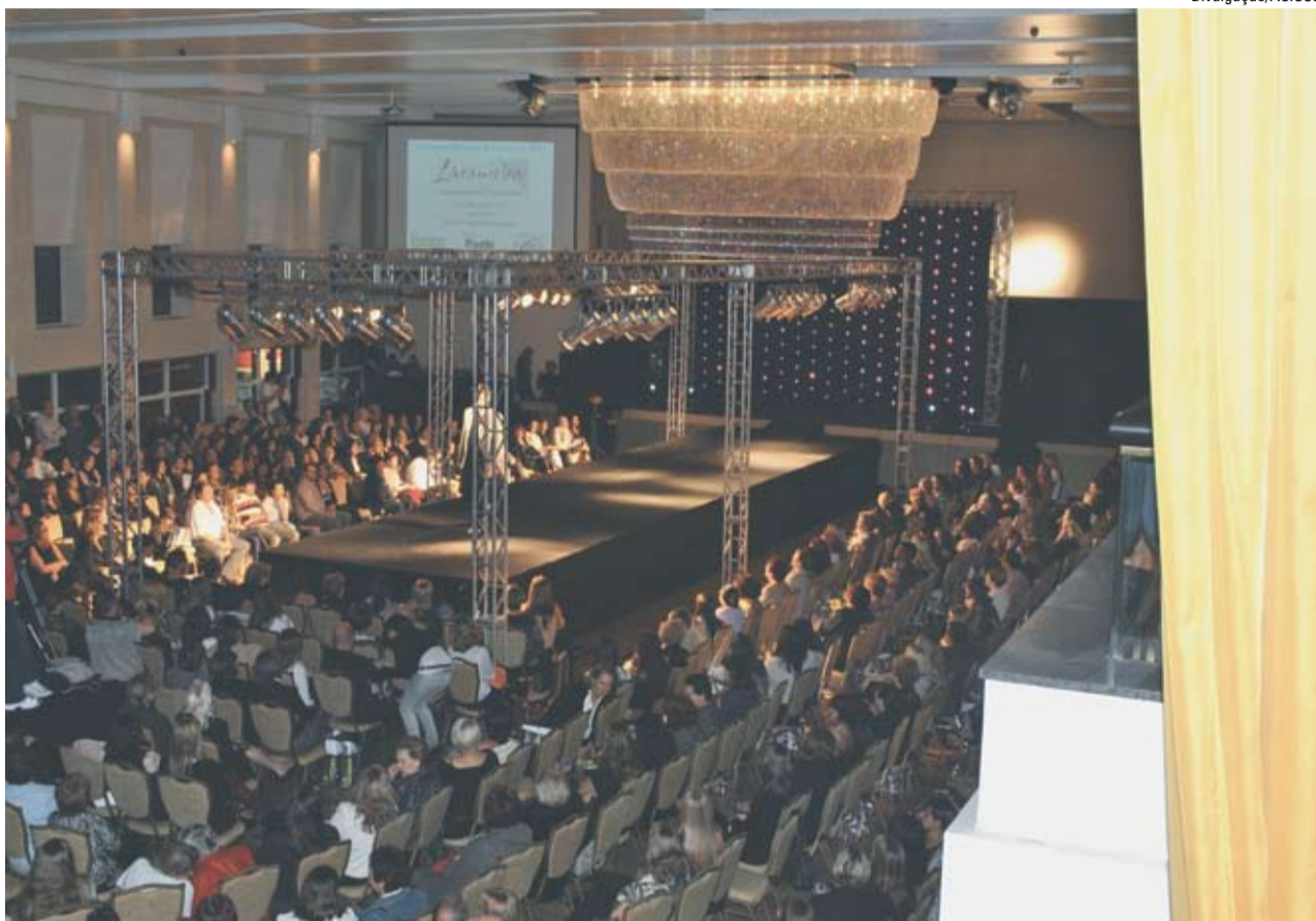
Mais de mil pessoas prestigiaram o São Caetano Fashion Day