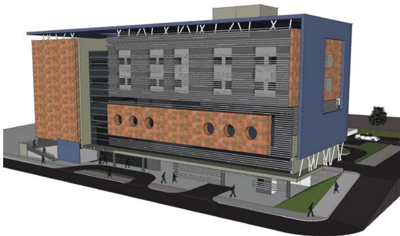
O projeto do novo hospital, que ficará na esquina da São Paulo e Vital Brasil

Já o 2º andar do Márcia Braido receberá a inter-