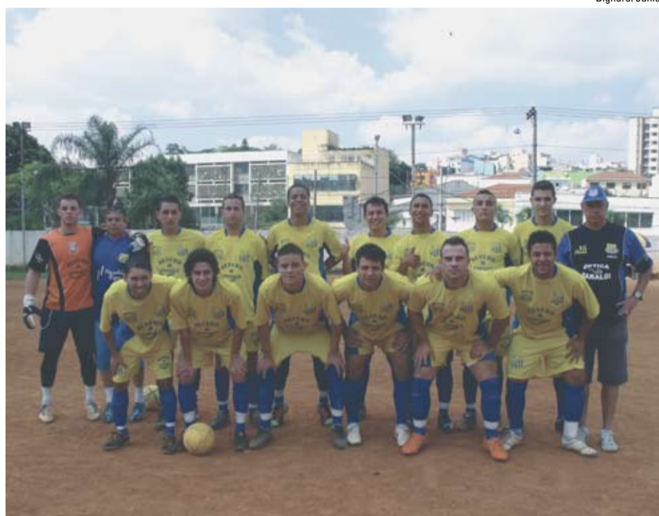
O Barcelona é um dos times que disputa o Amadorzão 2011

Metalúrgicos tem os mesmos 10 pontos ganhos, também com 3 vitórias e um empate. O lanterna é o Padre Cícero com 0 ponto.